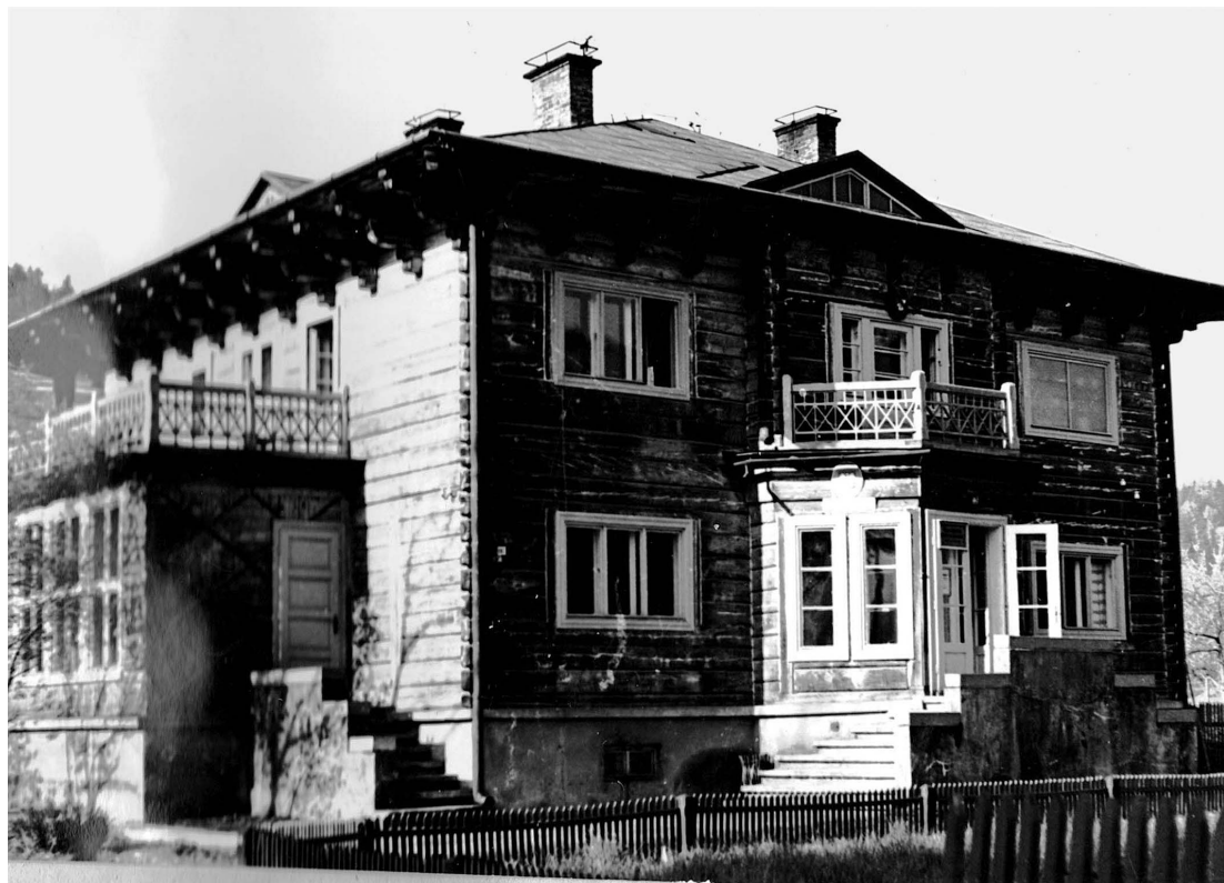
Fot. 3. Budynek dyrekcji Pienińskiego Parku Narodowego przy ul. Jagiellońskiej w Krościenku n.D. lata 50–60. XX w., (ze zbiorów Pienińskiego Parku Narodowego)

Phot. 3. Headquarters of the Pieniny National Park at Jagiellońska Street in Krościenko n.D. 50s–60s of 20 th century, (from the collections of the Pieniny NP)